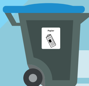
papier 1x per 4 weken legen