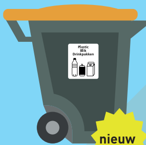
plastic 1x per 2 weken legen