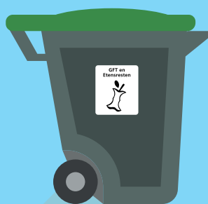
gft & etensresten 1x per 2 weken legen

Een deel van het afval dat hergebruikt of gerecycled kan worden, halen we al aan huis op. Dit zijn namelijk waardevolle grondstoffen. Dit doen we nu al met de bak voor gft en etensresten en de bak voor papier. Met het nieuwe systeem krijgt u ook een bak voor afval van plastic verpakkingen, blik en drinkpakken. Hiervoor ontvangt u in de loop van 2018 van HVC een nieuwe container.